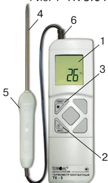
Рис. 1 ТК 5.01

Основные части прибора ТК 5.01, органы управления